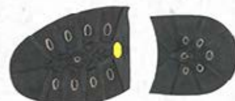
Vibram® Alaska 1/2 Semelle + Talon