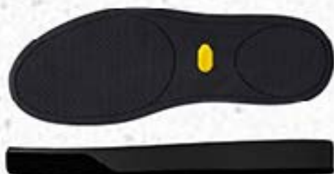
Vibram® 2148 Strighton