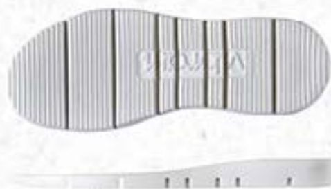
Vibram® 9105 Gloxy cut